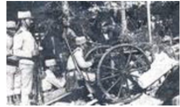
Lutas nas ruas de Lisboa durante a revolução republicana. (Fotogravura, 1910. Bilhete postal emitido por A Editora)

Cândido dos Reis não estava muito convicto de que os republicanos dispusessem do apoio militar suficiente para o triunfo da revolução, mas Machado Santos , continuava entusiasmado e queria avançar para a luta armada, o mais cedo possível.