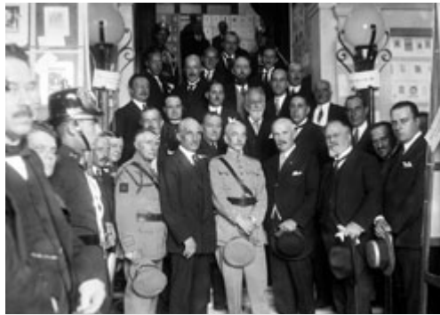
O presidente da República, general Carmona, o chefe do Governo, Vicente de Freitas e outros membros do governo na inauguração da exposição Ex-líbris na Biblioteca Nacional, 1927

Nestas circunstâncias, os governos da Ditadura Militar, resultantes em cada momento da relação de forças no seio da nova situação, estiveram longe de reunir qualquer “governo de competências”, se excluirmos desta designação as elites coimbrãs que abasteceram a nova governação de cargos técnicos deixados livres pelos militares (na Justiça, nos Negócios Estrangeiros, nas Finanças) e que, de forma progressiva foram aplicando o programa das direitas nacionalistas e integralistas, não garantindo portanto equidistância e competência “descomprometida”.