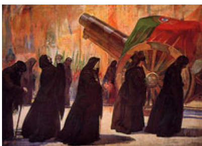
Funeral do Soldado Desconhecido. (Quadro da autoria de Sousa Lopes, 1927. Museu Militar).

Em 1919, Egas Moniz foi substituído por Afonso Costa (um fervoroso defensor de uma estratégia de exigência) nas conversações de Paz e no novo areópago internacional da SDN, tendo apresentado a candidatura de Portugal a um lugar para o Conselho Executivo da organização. No entanto, os resultados palpáveis obtidos ficaram muito aquém do desejado. O rearmamento do Exército a partir da redistribuição do material de guerra alemão não ocorreu e o pagamento das reparações arrastou-se pela década de 20, sem grandes resultados. Como refere José Medeiros Ferreira, “Nem a República, nem o Exército vêm consagradas a glória e a importância interna do seu esforço militar” [1] .