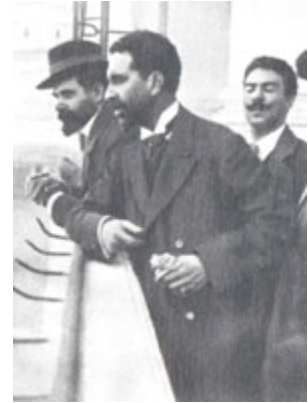
José Relvas, membro do Directório do Partido Republicano, à varanda da Câmara Municipal de Lisboa, na manhã do 5 de Outubro de 1910.

Na manhã do dia 5, após um cessar fogo de uma hora, pedido pelo encarregado de negócios alemão para embarcar os estrangeiros residentes em Lisboa, ocorria a rendição das tropas monárquicas perante Machado Santos . Pouco depois, era proclamada a República no edifício da Câmara Municipal de Lisboa .