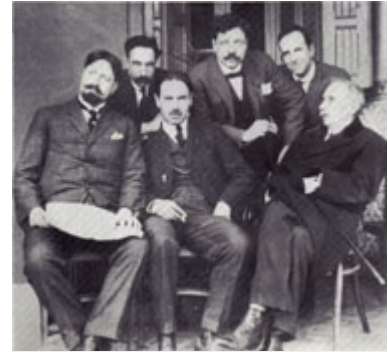
Grupo da SEARA NOVA: Da esquerda para a direita; de pé: Teixeira de Vasconcelos, Raul Proença, Câmara Reys; sentados: Jayme Cortesão, Aquilino Ribeiro e Raul Brandão.

Para levar por diante uma reforma do sistema bancário e uma tímida reforma agrária , Domingues dos Santos não poderia contar com o apoio dos “bonzos” do seu partido que, em coro com os nacionalistas de Cunha Leal, apodavam o ministro de “bolchevista”. Quando, no início de Fevereiro se decidiu pelo encerramento da Associação Comercial de Lisboa , tinha dado o seu passo em frente em direcção ao abismo: ninguém do partido apoiaria uma tal medida e a continuidade dos “exaltados” na condução dos negócios do Estado. Este “esquerdismo” era tanto mais preocupante quanto José Domingues dos Santos tinha o apoio da “rua” republicana: em 13 de Janeiro, 15 mil pessoas tinham invadido o Terreiro do Paço para protestar contra o desemprego e exigir ao Governo a reabertura das fábricas, o controlo operário e a descida decretada dos preços. Em resposta, o chefe do