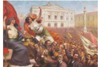
Eleições de 1908. Representação de J. Veloso Salgado, óleo s/Tela, 1913; dims. 3420x2610 mm. Este quadro, hoje existente no Museu da Cidade de Lisboa, representa as eleições para a vereação republicana da Câmara Municipal de Lisboa de 1908, ganhas pelos republicanos. Nas primeiras filas estão representados alguns dos republicanos mais destacados: António José de Almeida, Manuel de Arriaga, Bernardino Machado, Brito Camacho ou Afonso Costa.

Em finais de 1908, este compromisso histórico firmado em torno da refundação regeneradora da Pátria pela fusão da Nação com a República estava praticamente consolidado. O progresso da Ideia era assinalável: um núcleo de 7 deputados republicanos eleitos em 5 de Abril (onde avultava a figura de Afonso Costa) demolia de forma arrasadora todas as tentativas reformadoras da "Monarquia Nova"; a vitória da lista republicana para a Câmara de Lisboa, em Novembro desse ano, servida por reconhecidas competências técnicas na vereação, credibilizava a futura acção governativa do país pelos republicanos; uma acção de massas explosiva, centrada sobre comícios monumentais e uma vida associativa dos Centros Escolares Republicanos, intensa e proveitosa, juntava milhares de portugueses ao projecto republicano. O movimento reproduzia-se em organização, recrutamento e força: Lisboa era republicana e a revolução seria "matemática e fatal", pensava-se em finais de 1908.