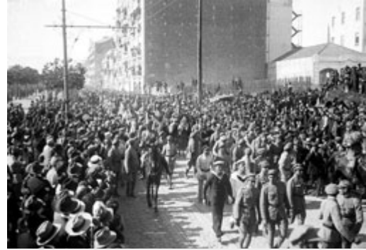
Golpe militar de 28 de Maio de 1926, o general Gomes da Costa seguido do seu estado-Maior, durante a parada militar realizada no Campo Grande após a vitória

Porém, a depuração das correntes constitucionais e o seu afastamento da área do poder depois do golpe Militar de 28 de Maio – e só concluída em 1932 com a vitória salazarista -, aí está para mostrar que nem todos os golpistas falavam da mesma “regeneração”. De facto, na forja estavam as ideias dos integralistas e dos republicanos de tendência anti-parlamentar que tão bem se haviam de casar no programa apresentado pelo general Gomes da Costa em Junho de 1926 [1]. Nesse programa eram apresentadas 8 bases fundamentais de um novo projecto de Constituição onde era adoptado o modelo republicano presidencialista na Chefia do Estado.