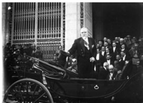
António José de Almeida à saída do Parlamento onde tomou posse como Presidente da República, 1919

No entanto, a reforma constitucional de 1919 ficou muito aquém das expectativas existentes e não contribuiu para a desejada democratização do regime. Evolucionistas e unionistas constituíram em Outubro o Partido Liberal e, nos dois anos seguintes, com a ajuda do novo Presidente António José de Almeida , procuraram contrabalançar a hegemonia do Partido Democrático. Colaboraram em governos de coligação dos democráticos , chefiaram três governos e promoveram eleições em 10 de Julho de 1921 , que ganharam com maioria relativa. Nenhuma das soluções foi bem sucedida e, em 19 de Outubro desse mesmo ano foram escorraçados por um golpe militar que conduziu o país à “ Noite Sangrenta ”, um dos episódios mais trágicos da República.