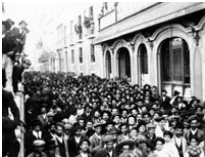
Greves de operários, promovidas pela União dos Sindicatos Operários. Os grevistas passam diante da redacção de O Século em direcção à Câmara Municipal de Lisboa, 1912.

A situação financeira do país permanecia deficitária. Nos primeiros anos da República os défices orçamentais, tão criticados pelo PRP durante a Monarquia, mantiveram-se até se agravaram. Os défices continuavam a ser financiados pelo aumento da circulação fiduciária, mas de acordo com os limites impostos pelo Decreto de 17 de Outubro de 1910 . Em 1913, no governo de Afonso Costa, à custa de uma diminuição drástica das despesas, as contas de gerência apresentaram um saldo positivo de 600 contos. Em simultâneo o Governo conseguiu inverter a tendência para o aumento da dívida flutuante que passou de 90108 contos, em meados de 1913, para 88702 no ano seguinte. Estes resultados nunca mais foram conseguidos até ao fim da República.