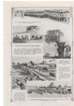
Vestígios da Expedição de Alves Roçadas ao Sul de Angola: companhias indígenas preparadas para o combate ao lado dos portugueses, casas incendiadas durante os levantamentos dos povos do Sul e imagens de tranquilidade depois dos desastres de Cuangar e Naulila. ( Ilustração Portuguesa , 28 de Maio de 1917)

Em 1914, um quarto de século sobre a muito sentida afronta nacional do Ultimato Inglês de 1890, os portugueses – e em particular alguns republicanos -, diziam-se dispostos a “morrer pela Pátria” em defesa dos “direitos históricos” sobre a “África Meridional Portuguesa”, o projecto que, em 1886, Barros Gomes idealizara para cimentar os alicerces do III Império lusíada. De facto, o acordo anglo-alemão de 1898 sobre as colónias portuguesas tinha provocado fortes apreensões em Portugal. Essas apreensões ganharam um novo fôlego em 1913, nas vésperas da Primeira Grande Guerra, depois do Convénio secreto assinado entre a Inglaterra e a Alemanha, em que a “velha aliada” abria as portas à colonização alemã em África, dispondo das colónias portuguesas para a realização de um acordo de paz. Perante esse acordo secreto, também a França se achava no direito de “reivindicar, no caso da liquidação do domínio colonial de Portugal (...) as Ilhas de Cabo Verde, a Guiné portuguesa, as Ilhas de S. Tomé e Cabinda”.