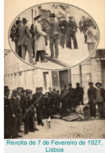
Revolta de 7 de Fevereiro de 1927, Lisboa

O golpe de 17 de Junho alterara as condições políticas para as quais a União Liberal Republicana dera o seu contributo. Mendes Cabeçadas , seu representante militar, havia sido afastado e a ULR prosseguia a sua acção político-partidária com as maiores dificuldades. Os efeitos da Ditadura fizeram sentir-se logo de imediato: o jornal A Noite , porta-voz do partido, foi silenciado pela censura em 5 de Julho de 1926. E, em 3 de Julho, Cunha Leal o líder da ULR, fora impedido de realizar uma conferência na Sociedade de Geografia de Lisboa, numa resposta a uma outra produzida, dias antes, por Martinho Nobre de Melo , um arauto e conselheiro político da Ditadura Militar. No entanto, o desfecho desta estratégia negociadora só culminou em 1930, com o embate político de Cunha Leal – a sua grande referência – com o “mago conimbricense” das finanças, a propósito da questão ultramarina.