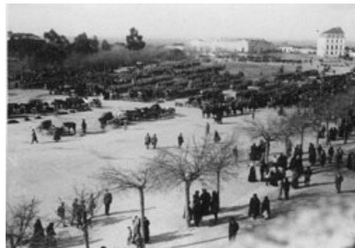
Revolta militar de Santarém

O biénio de 1919-21 decorreu sobre os efeitos económicos e sociais da I Grande Guerra. Com a morte de Sidónio, o bloco sidonista desfez-se em dois campos antagónicos que se confrontaram, durante os meses de Janeiro e Fevereiro de 1919, numa guerra civil que teve os principais afrontamentos na Revolta de Santarém , na Monarquia do Norte e na “ Jornada de Monsanto ”. De um lado, os monárquicos e integralistas que, através das Juntas Militares , pensavam ter chegado o tempo da restauração da Monarquia; do outro, os republicanos históricos que, aliados aos sectores reformistas do Sidonismo, entretanto desencantados, e à “ rua republicana ” se empenhavam na refundação da República.