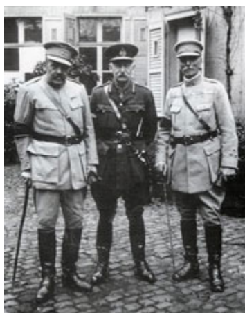
General Tamagnini Barbosa (à esquerda) acompanhado dos generais Hacking e Costa Gomes. Fernando Tamagnini de Abreu e Silva (Tomar, 1856-Lisboa, 1924) foi Comandante da Divisão de Instrução mobilizada em Tancos e Comandante do CEP, em França, até Agosto de 1918.

Se tivermos em conta o curto espaço de tempo que mediou entre as primeiras fases de instrução dos contingentes militares e a sua concentração em Tancos, sob o comando de Norton de Matos, dificilmente poderemos entender a expressão muito usada de “milagre de Tancos” fora de um quadro de mobilização e de propaganda. Entre a decisão de entrada de Portugal na frente europeia e o embarque dos primeiros contingentes, em Janeiro de 1917, mediaram uns escassos nove meses, um tempo insuficiente para realizar tudo o que se não fizera durante anos em matéria de organização e reequipamento militar. Não serão, portanto, de estranhar os motins de oficiais , a resistência dos soldados ou mesmo as revoltas contra a entrada de Portugal na guerra, como a que ocorreu em 13 de Dezembro em Tomar , sob o comando de Machado Santos, o “herói da Rotunda”. Para além de compreensíveis motivações políticas, estas reacções anti-intervencionistas reflectiam a consciência aguda da falta de meios humanos e materiais de um país pequeno, pouco industrializado e pobre, onde o armamento era arcaico e a formação militar limitada a escassos milhares de efectivos. Era já conhecido de todos o que havia acontecido em África: a falta de meios e a falta de reforços pedidos com insistência pelos comandantes tinham levado a que os efectivos tivessem baixado nalguns casos, por morte ou por doença, a mais de 75% do contingente inicial.