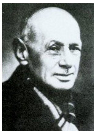
João de Barros

Os batalhões escolares constituíram outro dos meios da educação cívica republicana. Proclamada a República, logo em 26/10/1910, foi nomeada uma comissão presidida por João de Barros com o fim de elaborar um Regulamento de Instrução Militar Preparatória .