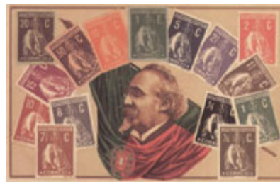
Manuel de Arriaga , primeiro Presidente da República eleito, envolto na Bandeira Nacional e acompanhado de selos da série Ceres .

Muito interessante também é o busto da "República" ou a sua representação de corpo inteiro, elaborados nos mais variados materiais, umas vezes de expressão ingénua, outras de forma elaborada, bebendo profunda inspiração em representações como "A Liberdade Guiando o Povo" (1830), de Eugène Delacroix. Reproduzida em escultura, em cartaz, em selos , na nova moeda , em pequena ou em grande dimensão, a "República" é um símbolo de uma riqueza e versatilidade quase infinitas. As alegorias à República são diversíssimas, embora quase sempre na base de uma figura poderosa, com túnica pendida, sandálias romanas, barrete frígio e seios normalmente desnudados. Como uma deusa (ou a Virgem dos católicos) vai transmutando os seus atributos em função dos objectos que carrega consigo: a palma da vitória; a balança da justiça; as rosas da beleza; o leão da força; a espada e a lança da condução dos exércitos; os seios desnudados da liberdade. Símbolo da coragem, da determinação, da decisão, a "República" é bem o melhor ícone da Pátria e da Nação republicana, uma espécie de transmutação do sagrado para a sociedade profana que se pretendia erigir. Com a degradação do regime, a "República" foi adquirindo defeitos nas mãos dos caricaturistas. Figura anafada, passa a motivo de mofa pelos erros e desilusões que acarreta: fina, esperta, impostora ou traidora.