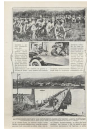
O ministro da Guerra Norton de Matos e os generais responsáveis pelo “Milagre de Tancos” atravessam uma ponte de barcas entre Tancos e o Arrepiado. Milhares de homens preparavam-se para sair para a frente de combate, depois de escassos meses de treino nas planícies da Chamusca. ( Ilustração Portuguesa , 4 de Dezembro de 1916)

A instrução dos primeiros contingentes concluiu-se em Agosto. Em 30 deste mês, uma missão militar franco-britânica de visita a Lisboa acordou com o Estado-Maior português a constituição do CEP e as diferentes formas de cooperação. O Corpo do Exército português seria composto de duas Divisões, comandadas pelos generais Gomes da Costa e Simas Machado , sob o comando geral do general Fernando Tamagnini e seria integrado no I Exército Britânico, comandado pelo general Douglas Haig.