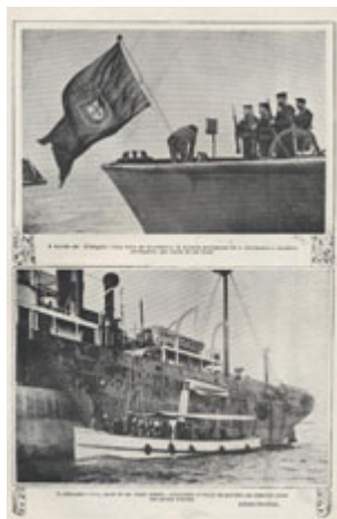
Forças da marinha portuguesa tomam posse dos navios alemães. ( Ilustração Portuguesa , 6 de Março de 1916)

Nestas circunstâncias, a ida dos primeiros contingentes militares, saídos em Setembro de 1914 de Lisboa para Angola, não só não provocou grande resistência da população, como até desencadeou algum apoio popular.