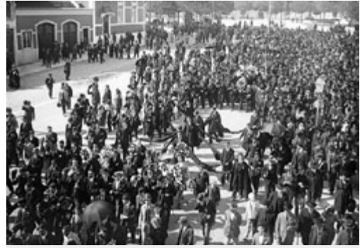
Funeral de António Granjo, Lisboa 1921

A miséria, a fome e a debilidade política da República (e depois a sua deriva autoritária ) alimentaram uma séria “ ameaça vermelha ” durante este “anos loucos portugueses”. O movimento operário, organizado na Confederação Geral do Trabalho (CGT), desencadeou fortes movimentos grevistas e, confrontado com a crise económica, enveredou pela “acção directa” e pelo sindicalismo revolucionário . O Partido Socialista Português tinha participado nos primeiros governos do biénio, tendo aí desenvolvido uma importante acção reformista na pasta do novo Ministério do Trabalho . No entanto, a partir de 1920, a sua acção descreditou-se e, no Governo do coronel António Maria Batista (um democrático ), a palavra de ordem era “Ordem Pública! Ordem Pública! Ordem Pública!”.