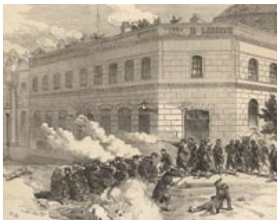
Lutas nas ruas de Paris durante a revolução da Comuna.

A inclusão do republicanismo num liberalismo de carácter democratizante não deixa margem para dúvidas, mas em relação ao positivismo não se pode postular que fosse esta a única corrente de pensamento a influenciar a elite intelectual republicana, pois, apesar da nítida influência da obra de Comte e, posteriormente, de Littré entre a maioria dos grandes vultos do republicanismo português, não se pode negar que também existiam outras tendências. Veja-se o exemplo de Sampaio Bruno , reconhecidamente anti-positivista e cujo ardor republicano não deixa margens para dúvidas. O positivismo republicano, como o positivismo português em geral, não revestiu carácter dogmático. Adoptando uma posição mais heterodoxa, reteve da obra comtiana a "teoria dos três estados" e a crença na necessidade imperiosa do advento do estado positivo, mas ao recusar as teses místicas do fundador não sistematizou propostas tendentes a institucionalizar uma "religião da humanidade". O positivismo em Portugal caracterizou-se fundamentalmente pelo seu cientismo e pela crença na evolução e no progresso.