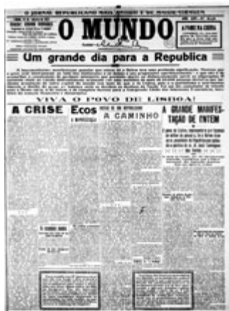
Notícia da manifestação de apoio ao governo de José Domingues dos Santos ( O Mundo , 14 de Fevereiro de 1925)

Não estava fácil a vida do Governo, na Primavera de 1924, apesar do piscar de olho de José Domingues dos Santos ao desesperado mundo operário, radicalizado por ideologias revolucionárias e por um combate de rua que minava a confiança das classes médias, apoiantes tradicionais da República. À direita, o Exército insistia na necessidade de um movimento militar que, ultrapassando a Constituição, impusesse um clima de ordem, com “pessoas de pulso, independentes de clientelas”.