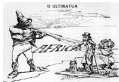
Caricatura alusiva ao Ultimatum . John Bull, representando a Inglaterra, faz fogo sobre o velhinho Portugal e o rei D. Carlos. ( A Paródia , 5 de Fevereiro de 1891)

Um outro aspecto relevante do pensamento republicano é o seu reconhecido anticlericalismo , característica muitas vezes associada à filiação maçónica de muitos dos membros do P.R.P.