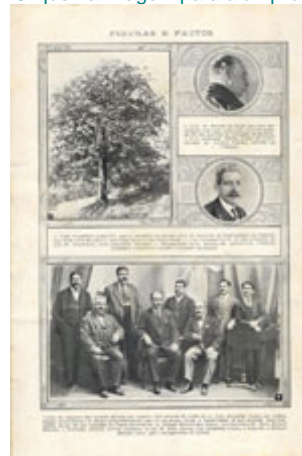
Visita do inspector das escolas móveis aos Açores. (Ilustração Portuguesa, 16 de Novembro de 1914)

A introdução de uma nova disciplina no currículo - educação cívica - com objectivos muito próximos da inculcação de valores, e também de alguns cultos cívicos como rituais simbólicos de uma pretendida nova religiosidade cívica - o culto da Pátria, da bandeira e dos grandes heróis - constituíram os principais contributos para a concretização dos objectivos republicanos nesta área. O nacionalismo e patriotismo, ideais mobilizadores destes cultos eram explorados também através dos programas de algumas disciplinas como História e Geografia.