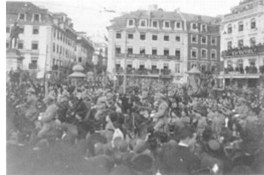
Parada militar no funeral de Sidónio Pais

uma miríade de conspiradores heterogêneos para derrubar o afonsismo pela força.