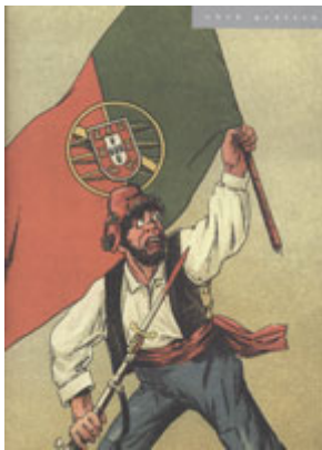
Postal comemorativo da Revolução de 5 de Outubro de 1910. Zé Povinho , travestido de revolucionário: de barrete frígio, empunhando na mão direita uma baioneta ensanguentada e na esquerda a Bandeira Nacional.

De fora deste bloco regenerador ficariam apenas as elites monárquicas e o clero reaccionário, que seria preciso destronar das habituais e ancestrais fórmulas de domínio: social, religioso e político. Sabia-se bem como o recrutamento dos homens para a Ideia republicana havia de fazer-se pela doutrinação e como esta havia de sustentar-se sobre uma nova "religião cívica", assente na "festa cívica", na reconstrução do imaginário colectivo, numa nova gramática simbólica e mesmo numa renovação das fórmulas administrativas.