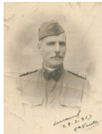
Gomes da Costa nas vésperas da 1ª Grande Guerra

A Nova República (1919-1926) parecia ter, temporariamente, refundado o regime em novas bases de legitimidade. No entanto, as diferentes recomposições partidárias nunca conseguiram resolver o problema da ingovernamentalidade do regime (veja-se Módulo V), porque, como considerava Cunha Leal, uma das estrelas deste período da República que, por duas vezes, desempenhou o cargo de ministro das Finanças, “...os problemas do pós-guerra eram tão agudos e os homens de Estado estavam tão pouco preparados para lhes encontrarem soluções adequadas que o prestígio destes não podia resistir a uma demorada permanência nas cadeiras do poder” [1]. Os “anos loucos portugueses” traziam no bojo problemas de uma magnitude desconhecida até aí: a crise financeira e económico-social debilitava o Estado, o funcionalismo público e as classes que viviam do salário; a ostentação dos novos-ricos do período da Guerra exacerbava sentimentos explosivos de contestação às desigualdades sociais, e estas alimentavam um sindicalismo revolucionário no seu auge de mobilização grevista.