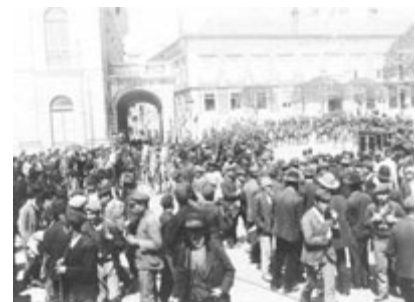
Largo de São Domingos durante a greve geral de 1912.

Em 16 de Junho de 1912 tomou posse um novo gabinete de concentração, chefiado por Duarte Leite , composto por três democráticos, dois unionistas e dois evolucionistas. A agitação continuou. Em 3 de Julho, Paiva Couceiro liderou uma segunda incursão monárquica agrupando manuelistas e miguelistas que desencadeou outras sublevações. Após a difícil vitória republicana seguiu-se a habitual prisão dos conspiradores e o seu julgamento em três tribunais militares, criados em Braga, Coimbra e Lisboa.