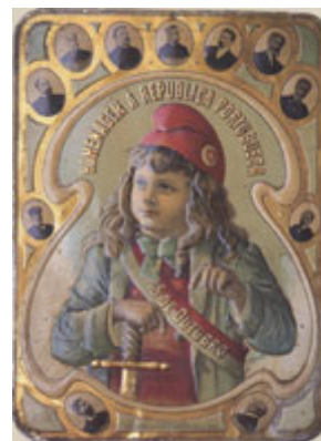
Primeira República Portuguesa. 5 de Outubro.

A crise política e financeira de finais de século XIX, o arcaísmo sócio-económico e cultural do país e a sua dependência externa encarregaram o Partido Republicano (as classes médias urbanas, as suas elites civis e militares e as aristocracias operárias) de resgatar Portugal do "atraso histórico" que todos diagnosticavam e do declínio "inevitável", caso não fosse invertido o rumo dos acontecimentos nefastos que se iniciaram com o Ultimato de 1890.