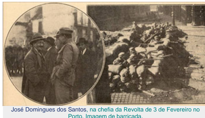
José Domingues dos Santos, na chefia da Revolta de 3 de Fevereiro no Porto. Imagem de barricada.

Como afirmou Jaime Cortesão [1], um dos líderes, o bloco político que tinha conduzido à Revolta de Fevereiro de 1927 era constituído por “republicanos cuja actividade se tem [tinha] exercido fora da estrita actividade política, da vida partidária”. E acrescentava ainda que dos 150 oficiais presentes na “Revolução do Porto”, só cerca de 10% tinham filiação partidária. O movimento tinha congregado o maior número de escritores e propagandistas, visava restaurar o regime constitucional e constituir “um forte governo nacional, composto por algumas das mais honradas figuras da República”. Era um movimento que se recusava a aceitar o statu quo ante , e pretendia regenerar e moralizar a República.