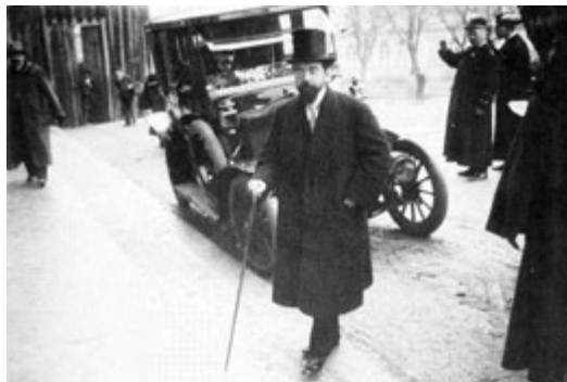
Engenheiro António Maria da Silva

Impossibilitada de governar por via legal, a direita parlamentar havia de esperar dois longos anos, até finais de 1923 para ter de novo oportunidade de assumir o poder: restava-lhe uma outra tentativa de recomposição partidária (que veio a ocorrer em Fevereiro de 1923, com a fundação do Partido Nacionalista ), ou o recurso aos meios violentos e extra-parlamentares da conjura, do golpe ou da revolução.