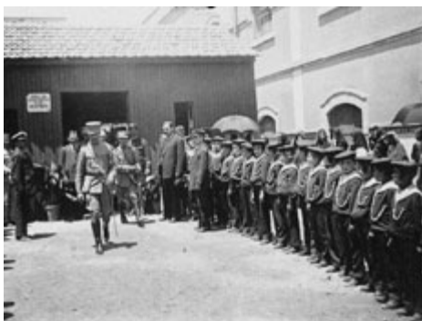
O Presidente Sidónio Pais visita o asilo Dona Maria Pia onde está instalada a “sopa dos pobres”, 1918

Rodeado dos seus “ cadetes ”, ocupou a Rotunda – o mítico lugar de nascimento do próprio regime – em 5 de Dezembro de 1917, dando lugar ao “ dezembrismo ”, uma espécie de mudança de turno que, a breve prazo, se havia de transmutar no ponto de encontro de todas as promessas de futuro. Sidónio prometeu e quis tudo: um “Presidente-Rei”, na expressão consagrada de Pessoa, como aquele que abraça todos os portugueses (republicanos e monárquicos, democratas e anti-democratas, conservadores e revolucionários) num desígnio patriótico de “salvação da Pátria”. Em nome do combate à “demagogia democrática”, fechou o Parlamento, proibiu a actividade dos partidos republicanos históricos e instalou-se em Belém no lugar de Bernardino Machado , o Presidente eleito. Até às eleições de 28 de Abril , governou como um “ César ”, com o apoio de uma ditadura de militares. Em lugar de uma República multipartidária, Sidónio fundou um partido único – o Partido Nacional Republicano .