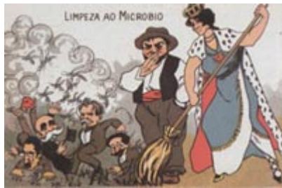
A Monarquia tentando varrer os republicanos que a vão atacando como moscas furiosas deixando os seus "micróbios". (A Paródia, 5 de Fevereiro de 1891)

O percurso eleitoral do Partido Republicano foi, desde 1878, de difícil e fraca expressão, devido não só às características da legislação eleitoral , como às ilegalidades que se verificavam durante as campanhas e no decurso dos escrutínios. Como protesto pelas limitações impostas pela legislação o PRP não concorreu às eleições de 1895 e 1897. Os republicanos que, na maioria das vezes concorriam com candidaturas próprias, chegaram a fazer algumas alianças, como aconteceu, em 1890, com alguns sectores monárquicos progressistas e, em 1900 e 1901, com os socialistas, formando a denominada Concentração Democrática . De qualquer modo, as esperanças de que o partido pudesse vir a ascender ao poder por via eleitoral eram praticamente nulas e as tendências discordantes que se tinham manifestado no Congresso de 1891 e que separaram os republicanos do Norte e do