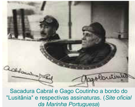
Sacadura Cabral e Gago Coutinho a bordo do “Lusitânia” e respectivas assinaturas.

A partir de Agosto de 1923, o governo toma uma série de medidas de contenção, entre as quais avulta a decisão de acabar com o “pão político” e a instituição do regime livre de comercialização dos cereais. Esta política hesitante de cedências, ora à esquerda ora à direita, tornou-se responsável pelo desmoronamento da maioria governamental e pela recomposição do bloco conservador de direita, constituído temporariamente em torno do Partido Nacionalista.