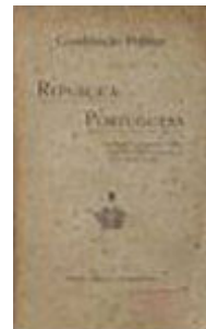
Folha de rosto da publicação da Constituição de 1911

As eleições para a Assembleia Nacional Constituinte que iria elaborar a primeira constituição republicana portuguesa, tiveram lugar no dia 28 de Maio de 1911. Para a realização deste acto tão importante e de tão grande significado político a República esteve muito longe de cumprir um dos grandes desígnios da sua propaganda durante o regime monárquico - o sufrágio universal . O regime republicano acabou com a limitação censitária que tanto criticara na oposição, mas introduziu uma outra, tanto ou mais limitativa - o sufrágio capacitário. De acordo com a legislação que regulamentou as eleições de 1911, a condição de eleitor só era atribuída aos cidadãos com mais de 21 anos que soubessem e escrever ou que fossem chefes de família há mais de um ano, o que, dado os elevados níveis de analfabetismo da sociedade portuguesa da época, era extremamente restritivo.