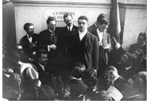
Cunha Leal discursando no funeral de António Granjo, o chefe do governo assassinado na chamada “Noite Sangrenta” (Câmara Municipal de Lisboa. Arquivo Fotográfico)

A pouco mais de dois anos do golpe de 28 de Maio de 1926, começava a desenhar-se aqui a “solução” ditatorial que havia de derrubar a República. Com a queda do Governo em que participou, Cunha Leal tornou-se ele próprio um arauto dessa alternativa insurreccional que, a partir desta data, ganhava corpo. Em 17 de Dezembro, numa conferência na Sociedade de Geografia de Lisboa e na presença de mais de 500 oficiais do Exército (entre eles o próprio general Carmona, futuro chefe da Ditadura Militar), Cunha Leal, defensor de uma solução constitucional e civilista, alertava para o rumo mais que previsível (e inevitável?) do país: “As ditaduras hão-de vir, quer queiram quer não, pela força inevitável dos acontecimentos”