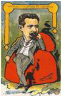
Afonso Costa encostado a um enorme barrete frígio observa a Monarquia que se vai esboroando. (Caricatura de Alfredo Cândido, 1906. Bilhete postal emitido por A Editora)

Com a agitação política e a repressão que se verificou ao longo de todo o ano de 1907, intensificou-se a campanha do Partido Republicano cuja propaganda revestia aspectos de extrema violência, como aconteceu na visita de João Franco ao Porto , onde as impressionantes manifestações de hostilidade deram origem a recontros entre o povo e a polícia, de que resultaram numerosas vítimas e um considerável número de prisões, ocorridas em consequência das agitadas manifestações de desgosto com que o ditador foi recebido à sua chegada a Lisboa.