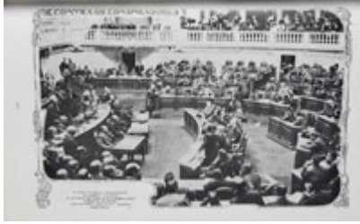
Sessão de 16 de Outubro de 1911, na qual se discute a suspensão das garantias constitucionais para os conspiradores monárquicos ( Ilustração Portuguesa , 2 de Outubro de 1911)

O governo de Afonso Costa não conseguiu travar a agitação política e social, vendo-se forçado a usar de várias medidas repressivas. Do ponto de vista político, assistiu-se ao golpe radical de 27 de Abril , primeiro golpe de republicanos contra republicanos. Além das severas medidas repressivas, uma das consequências do golpe foi a criação da formiga branca , rede de espionagem ligada ao ao Partido Democrático. Após uma nova tentativa radical em Julho , o governo confrontou-se com novo golpe em Outubro, desta vez liderado pelos monárquicos chefiados por João de Azevedo Coutinho , a chamada primeira outubrada .