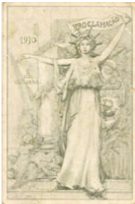
Alegoria à proclamação da República. (Postal Ilustrado, 1910).

Após o trabalho de recrutamento passou-se à elaboração do plano do movimento revolucionário, para o qual concorreram três oficiais de carreira: o capitão Sá Cardoso e os tenentes Hélder Ribeiro e Aragão Melo. A cidade foi dividida em zonas para as quais se disporia de 60 grupos de civis, cada um deles constituído por 16 homens - 5 armados com 5 bombas cada um, 5 com pistolas-metralhadoras e 6 desarmados que tinham por missão a vigilância e a transmissão de ordens. A esta organização civil juntava-se a preparação militar do golpe que tinha como objectivo o ataque simultâneo a três pontos considerados fundamentais: o Quartel do Carmo, o Quartel-General e o Palácio Real das Necessidades, onde o rei devia ser preso.