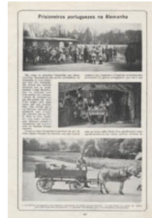
Prisioneiros portugueses na Alemanha. (Ilustração Portuguesa, 24 de Junho de 1918)

No Parlamento, a vitória dos Aliados foi comemorada em 3 de Dezembro, num clima pouco optimista, que antecipava os ajustes de contas dos dois blocos – intervencionistas e anti-intervencionistas – no pós-guerra. Cunha Leal , um jovem deputado que se afastou por essa altura do “bloco sidonista” afirmava: “Sonhou-se entre os nossos governantes com a vitória da Alemanha. E, por isso, a derrota do colosso germânico caiu-lhes em cima da cabeça como um balde água fria”.