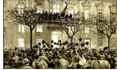
Gravura alusiva à proclamação da República na Câmara Municipal do Porto, em 31 de Janeiro de 1891.

O facto de o PRP colocar acima de qualquer outra questão o derrube da Monarquia não queria dizer que o partido não se preocupasse com a difusão dos seus ideais. Para a propaganda das suas doutrinas foram criadas inúmeras agremiações que, por todo o país contribuíram para a difusão do republicanismo. A estratégia de propaganda do PRP não se limitou a esta acção divulgadora. Frequentemente o partido organizava grandiosas manifestações populares, comícios, festas, marchas de protesto, que, não raro, eram severamente reprimidas pelas forças da ordem, com prisão dos mais activos dirigentes. Apesar da repressão a propaganda republicana ia alastrando, principalmente nos centros urbanos, o que não deixava de ser motivo de preocupação para os governos monárquicos.