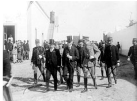
Manuel Teixeira Gomes, Presidente da República, acompanhado do chefe de Governo, António Maria da Silva, visita o quartel da Artilharia 1, 1925

Na “nova República velha”, o que vem a faltar ao Partido Democrático é uma manifesta incapacidade para perceber até que ponto as novas clivagens sociais do pós-Guerra se tornaram fracturantes e para aceitar a necessidade de novas formas de representação política. Durante estes anos, a República balanceou entre um multipartidarismo de partido dominante (embora não hegemónico) e a ansiada emergência, por sectores que se não reconheciam no Partido Democrático, de um partido ou bloco alternante das direitas conservadoras. Ou, em alternativa ainda, de um partido da esquerda democrática, capaz de representar o povo miúdo, muito sacrificado pela crise económica, o desemprego e a política repressiva dos governos da República.