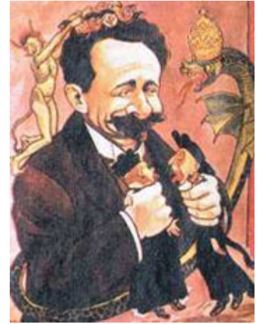
Caricatura alusiva ao anticlericalismo republicano. Afonso Costa estrangula o clero, enquanto é ele próprio enlaçado pela hidra da reacção clerical que ostenta a tiara papal. (Alfredo Cândido, 1906. A Editora )

Com a vitória republicana foi de imediato constituído e anunciado um Governo Provisório sob a presidência de Teófilo Braga. Neste governo, estavam representados os mais destacados vultos da propaganda republicana nos últimos anos da Monarquia, com relevo para Afonso Costa que viria a emergir como o vulto dominante da política nos primeiros tempos republicanos. A composição do governo ressentia-se das mortes inesperadas de Miguel Bombarda e Cândido dos Reis e do afastamento de Basílio Teles , considerado um dos principais mentores do republicanismo e um dos históricos do 31 de Janeiro de 1891 . Apesar destes imprevistos, no governo estavam representadas as mais notáveis figuras das principais tendências do PRP: Afonso Costa na Justiça e Cultos; António José de Almeida no Interior; António Xavier Correia Barreto na Guerra; Amaro de Azevedo Gomes na Marinha; Bernardino Machado nos Negócios Estrangeiros e António Luís Gomes no Fomento. Poucos dias depois, em 12 de Outubro, José Relvas assumia a pasta das Finanças em substituição de Basílio Teles que nunca chegou a tomar posse e, em 22 de Novembro, Brito Camacho tomava o lugar de Azevedo Gomes na pasta da Marinha.