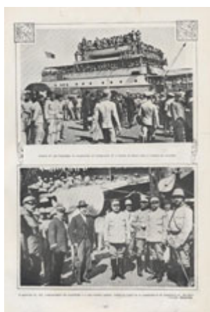
Embarque de tropas de Infantaria 22 com destino à África Oriental (Moçambique). (Ilustração