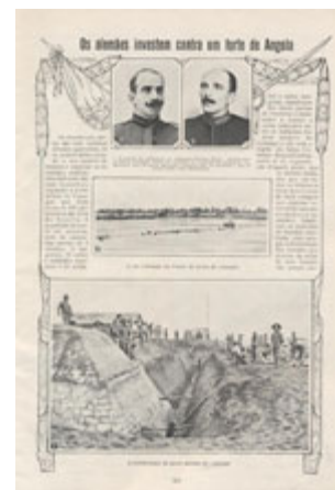
Os alemães investem contra um forte de Angola. Fortificação de Cuangar. (Ilustração Portuguesa, 30 de Novembro de 1914)

Na verdade, o projecto republicano, nacional e patriótico, defendia que a soberania portuguesa e a independência nacional haviam de sustentar-se sobre a “empresa de além-mar”, uma espécie de “utopia lusitana” que pretendia retomar nos finais do século XIX e início do seguinte a “gesta heróica de Quatrocentos”. A campanha de África de 1914 correspondia assim, com uma razão muito evidente para os contemporâneos, a uma empresa nacional de defesa intransigente da estratégia atlântica que se começara a desenhar desde os finais do século anterior. Portugal existira livre na história e resistira à Espanha porque se prolongara além-mar. Oficiais “guerristas” como Augusto Casimiro – o “poeta-soldado” da Renascença Portuguesa -, não-de fazer acompanhar o seu patriotismo cívico de um outro patriotismo, de carácter messiânico, inspirador de todos os heroísmos e justificador da muito esforçada intervenção nacional na guerra.