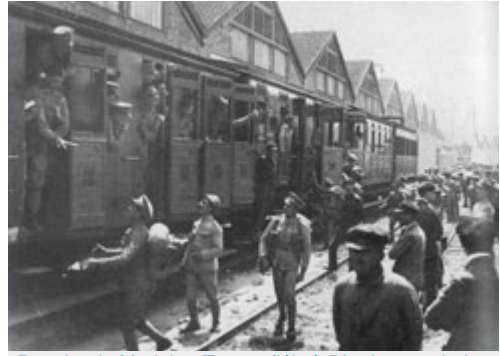
Revolta da Madeira. Tropas fiéis à Ditadura enviadas para combater a Revolta de 1931 na Madeira.