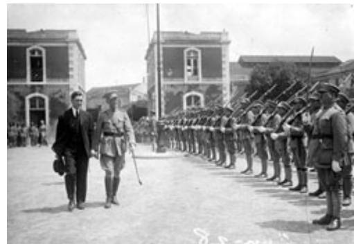
O presidente do Ministério, Domingos de Oliveira, e o ministro das Finanças, Oliveira Salazar, passando revista às tropas, no Governo Militar de Lisboa

A reacção a Mendes Cabeçadas começou com a nomeação de Gomes da Costa para ministro da Guerra, no dia 3 de Junho. À sua volta, uma entourage de oficiais reaccionários, tomou por sua conta o desarme das tropas leais a Mendes Cabeçadas (no Algarve, em Trás-os-Montes e em Mafra). Daí em diante, tinha cada vez menos força para impedir a tomada de poder por Sinel de Cordes e por toda a extrema-direita militar. O golpe definitivo ocorreu depois do Conselho de Ministros de 14 de Junho, onde foi apresentado o “programa de acção” governamental de Gomes da Costa, a exigência do preenchimento do cargo de ministro das Finanças pelo General Sinel de Cordes e a nomeação de Gomes da Costa para a Presidência da República. Era um programa que propunha um reforço dos poderes presidenciais, um sistema presidencialista de governo, uma representação orgânica da nação e uma nova lei eleitoral.