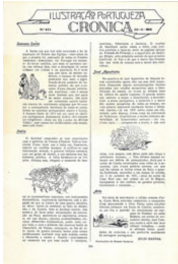
Notícia referente à promulgação da Lei de Separação entre o Estado e as Igrejas ( Ilustração Portuguesa , 29 de Março de 1915)

Quatro dias depois da publicação do Decreto de 8 de Outubro, era fixado o calendário dos dias feriados, donde eram retirados todos os que tinham conotação religiosa. As tradicionais datas de 1 de Janeiro e 25 de Dezembro eram mantidas, mas atribuíam-se-lhe outros significados: o dia 1 de Janeiro era consagrado à fraternidade universal e o dia de Natal, perdia esta designação para passar a ser celebrado como o dia consagrado à família. À parte estes, eram ainda considerados feriados, o dia 31 de Janeiro, dedicado aos precursores e aos mártires da República, o dia 5 de Outubro, consagrado aos heróis da República e o dia 1 de Dezembro, celebrando a autonomia da pátria portuguesa.