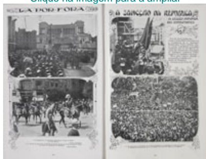
Fotos da sessão inaugural da Assembleia Constituinte.

Nas eleições para a Assembleia Nacional Constituinte nem todos os deputados foram eleitos, porque o Decreto de 14 de Março previa que não seria necessário realizar eleições nos círculos onde não se apresentassem candidaturas da oposição. Deste modo, 91 dos deputados foram efectivamente nomeados. A excepção verificou-se em Lisboa onde, face aos protestos verificados, se realizaram as eleições, apesar de não existirem listas da oposição. O PRP conseguiu uma vitória esmagadora com 97,6% dos votos. O PS que se candidatou em 12 círculos, apenas conseguiu eleger 2 deputados. No total, a Assembleia era constituída, por 234 deputados, sendo 229 em representação do PRP, 3 independentes e 2 socialistas. [1]